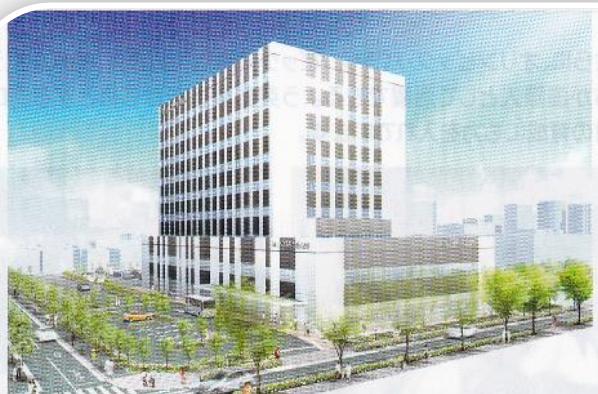
平成28年度末開設予定の新病院のイメージ

区内の医療環境の充実のため、新小岩地区の旧松上小学校跡地を活用した病院誘致が実現しましたが、現在では、旧校舎の解体も完了し、平成 28 年度末の新病院開設に向けた準備が進んでいます。