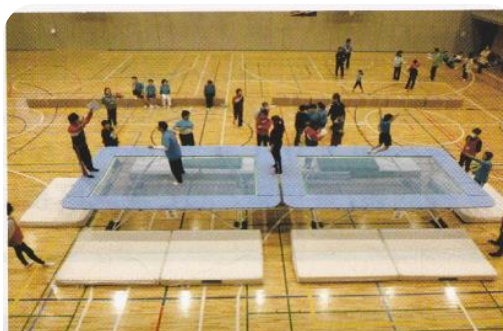
平成26年4月20日トランポリン交流大会

2020 年東京オリンピック・パラリンピック大会まで、あと 5 年となりました。オリンピックの開催は、多くの人々のスポーツへの参画はもとより、日本の文化や芸術を世界に発信する絶好の機会でもあります。