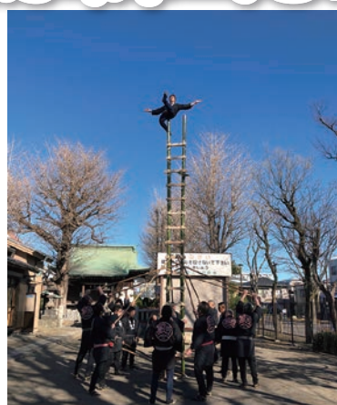
1/5 恒例の「新春はしご乗り」 地元高木神社にて