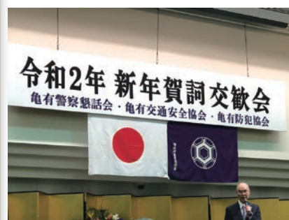
亀有警察懇談会 新年会