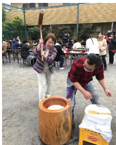
1月 前津町会「お餅つき」