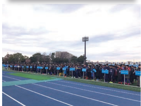
1/11・12 キャプテン翼cup かつしか2020 開会式・奥戸総合スポーツセンター