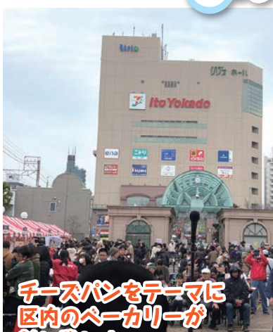
チーズパンをテーマに 区内のベーカリーが 熱い戦い!