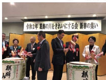
2/14 川をきれいにする会