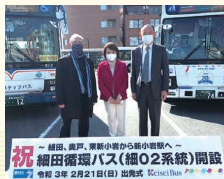
2月21日 葛飾区細田循環バス出発式