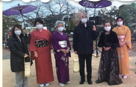
2月13日 冬の堀切菖蒲園 和と光のおもてなし