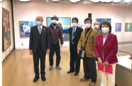
2月21日 第29回葛飾の美術家展