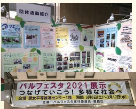
3月6日 パルフェスタ 2021 展示会