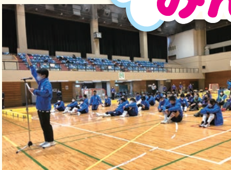
1月23日 第4回東京都 フロアホッケー交流競技大会