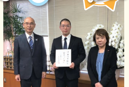
3月10日 自衛隊入隊者激励会