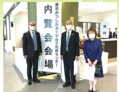
5月15日 東京かつしか赤十字母子医療センター