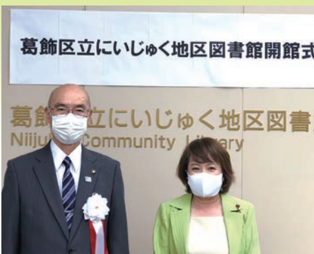
6月2日 葛飾区にいじゅく地区図書館開館