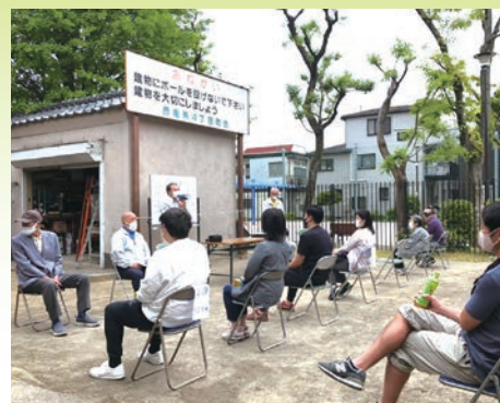
5月5日 西亀有四丁目町会総会