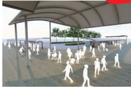
駅前広場出入口 完成イメージ