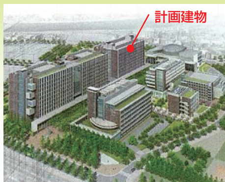
6月28日 東京理科大学II期工事起工式に行ってきました