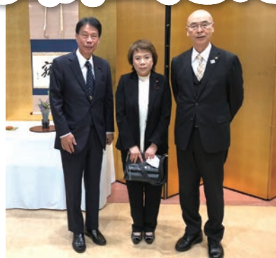
令和2年10/18 第65回 区民文化祭