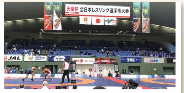
令和2年12/17～20 全日本レスリング選手権