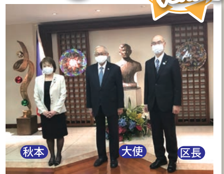
令和2年12/15 フィリピン大使館表敬訪問