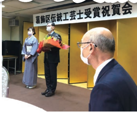
令和2年10/23 伝統工芸士受賞祝賀会