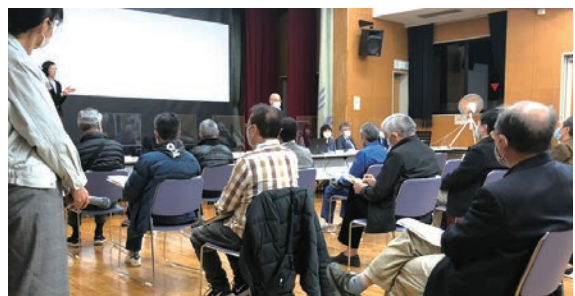
令和2年12/7 区長と区民の意見交換会