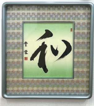
第13回 葛飾現代書展 令和2年11/21～27