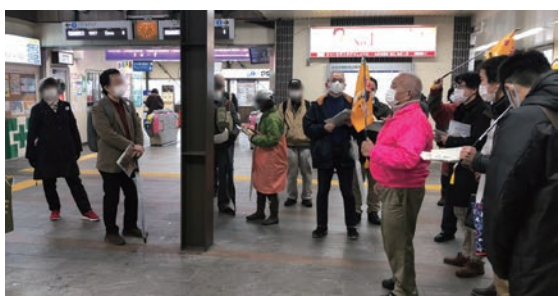
令和2年12/5 銭湯ウォーク