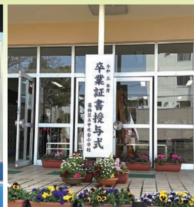
葛飾区立中之台小学校 卒業式 令和4年3月25日