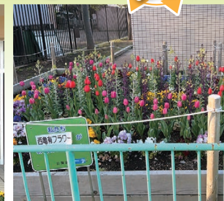
西亀有フラワー チュウリップ組