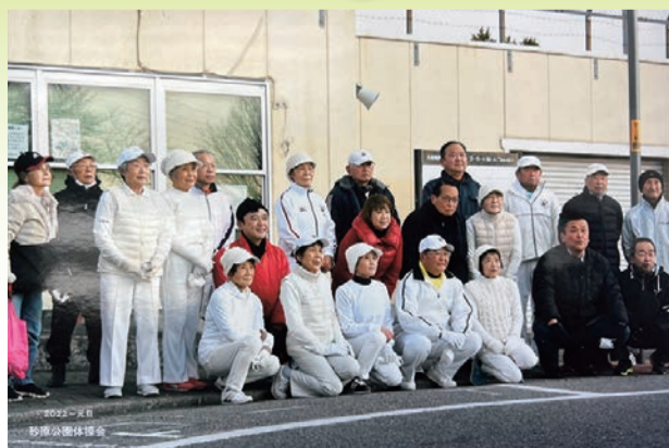
上千葉砂原公園体操会 令和4年1月1日