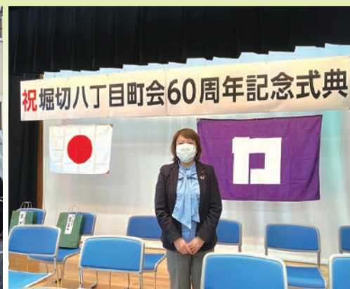
堀切八丁目町会 60 周年記念式典 令和4年3月20日