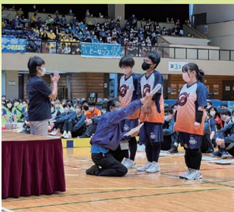
第17回全日本フロアホッケー競技大会 令和4年10月15日～16日