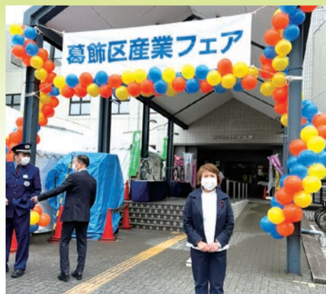
第38回葛飾区産業フェア 令和4年10月14日～、21日～