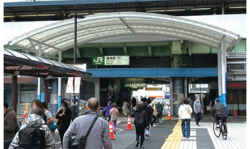
亀有駅ロータリー