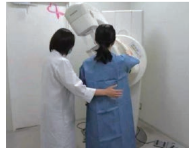
乳がん検診を受診しやすい環境づくり