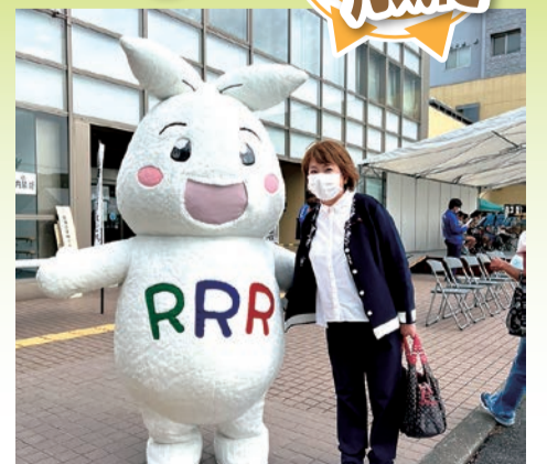
ゴミ減量清掃フェアかつしか 令和4年10月9日