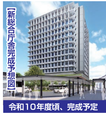
令和10年度頃、完成予定

新しい総合庁舎は、立石駅北口地区市街地再開発事業で建築される建物に整備する予定です。