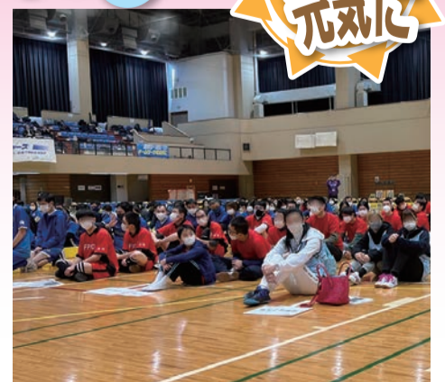
フロアホッケー交流競技大会 奥戸総合スポーツセンター 令和5年1月21日