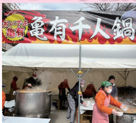
おいでよ亀有「亀有千人鍋」 令和5年2月4日