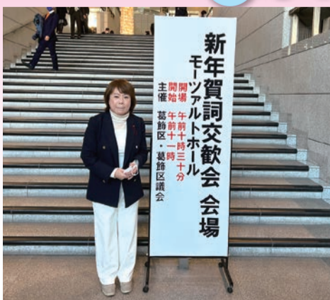
令和5年 新年賀詞交歓会 シンフォニーヒルズ 令和5年1月5日