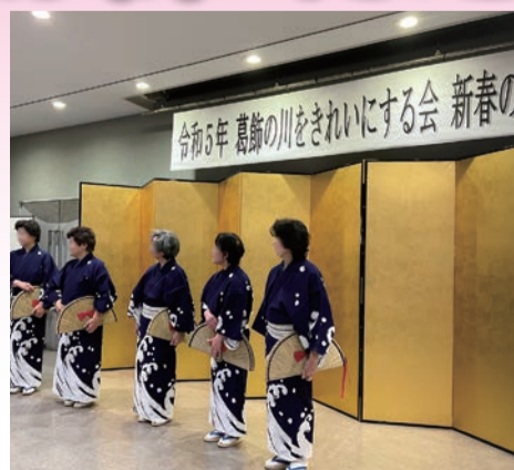
葛飾の川をきれいにする会 新春の 令和5年2月24日